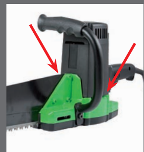
Griff beidseitig montierbar